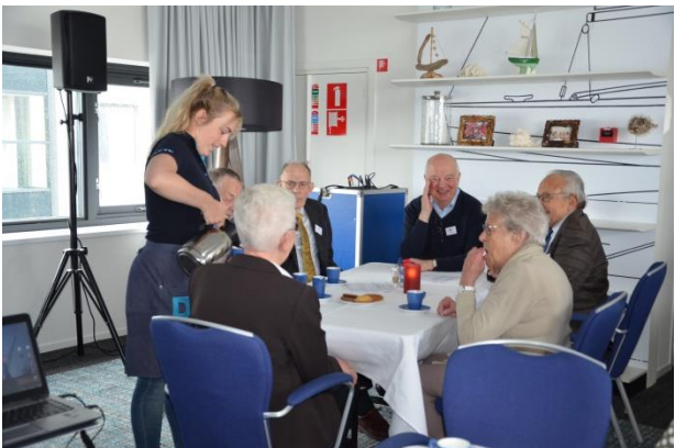
De koffie wordt geschonken