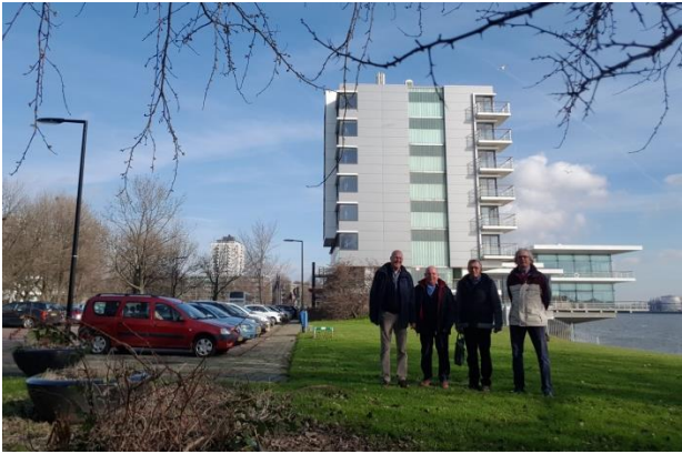
Organisatie oud WTK's bij Delta Hotel