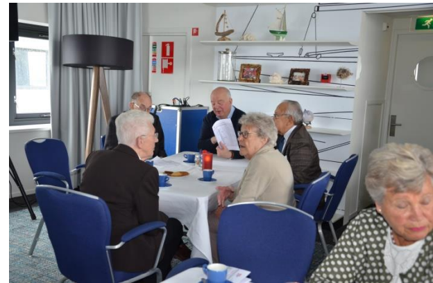
Even bij kletsen