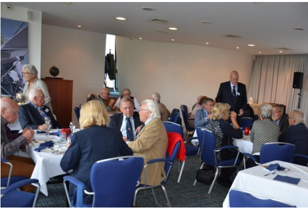
Nog even napraten