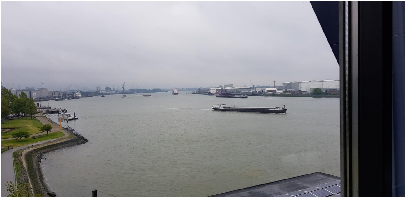
Een prachtig uitzicht over de Nieuwe waterweg